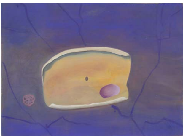
Lotus bleu et or, encre et pigments sur toile 1.50 X 2m