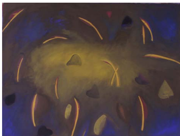
Lotus naissance, encre et pigments sur toile 1.50 X 2m