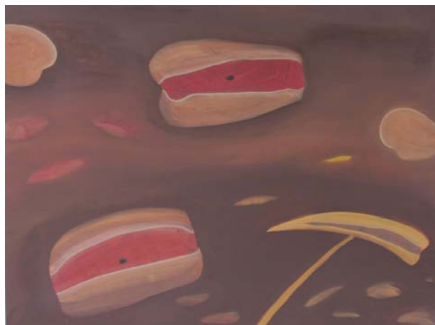
Lotus babay leaf, encre et pigments sur toile 1.50 X 2m