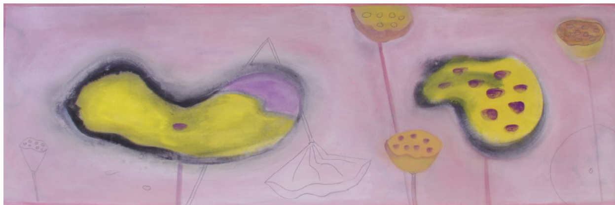
Lotus rose, graines encre et pigments sur toile – 0,49 X 1,58 m

Peintre de l'invisible mouvement des choses, alchimiste de l'entre-deux, là où les espaces ne sont plus séparés par un principe d'organisation, Marie Hugo présente avec sa nouvelle série "Les trois cents jours du Lotus", l'essence d'un ambitieux projet en cours de réalisation. Un prélude qui ne cherche à rendre compte ni de la mise en oeuvre , ni de son évolution, encore moins du résultat à venir, mais à nous plonger dans cet état si particulier, si inhabituel, de silence, d'accueil et d'écoute qui favorise la résonance. La résonance avec un univers autre et pourtant nôtre.