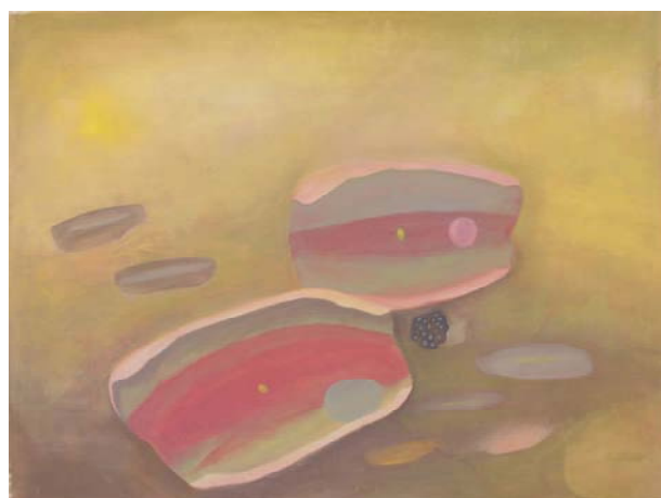
Lotus jaune, encre et pigments sur toile 1.50 X 2m

Les racines de Marie Hugo puisent à divers héritages à partir desquels s'élabore la singularité de son propre univers. Celui de l'arrière-arrière grand-père Victor dont les milliers d'eaux encrées, pleines d'orages, sont restées en marge des écrits du grand homme de lettres qu'il fut. Puis celui de son propre père, Jean Hugo, ce "célèbre méconnu", comme le définissait Maurice Sachs, dans l'atelier duquel, enfant, elle accepte les plus modestes tâches pour accéder de façon privilégiée à la magie onirique de cette peinture libérée du poids du temps qui enchantait Cocteau et Picasso, et bien d'autres grands artistes encore de l'entre-deux guerres. Enfin, celui de la Nature à travers l'exploration du vaste jardin de Fourques qui, d'un seul souffle, comme dans les voyages chamaniques, emmènera Marie Hugo aux confins de l'Extrême-Orient où elle vivra plusieurs années.